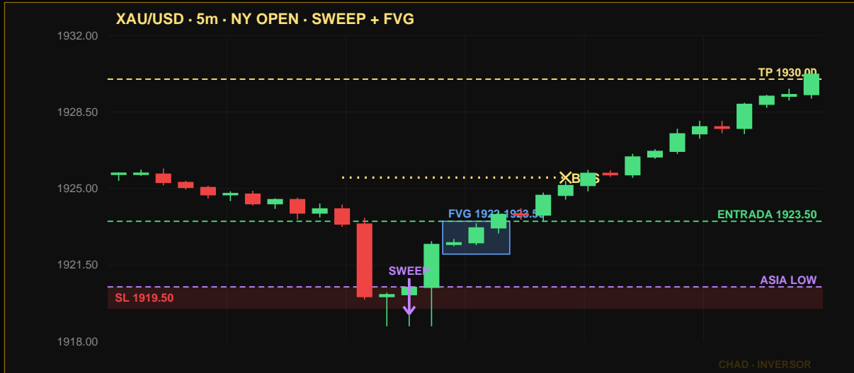
Caso 1: Apertura NY liquida los mínimos asiáticos (SWEEP), impulso alcista crea FVG, entrada en la mitigación.