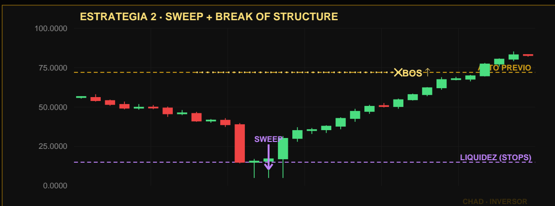
Precio baja tomando los stops debajo del mínimo (SWEEP) → reversión violenta → rompimiento estructural al alza (BOS).

La Ejecución: Identificamos la toma de liquidez en un máximo o mínimo. Luego, bajamos a 5m. Si vemos un rompimiento de estructura (BOS) fuerte en dirección contraria, entramos en el retroceso.