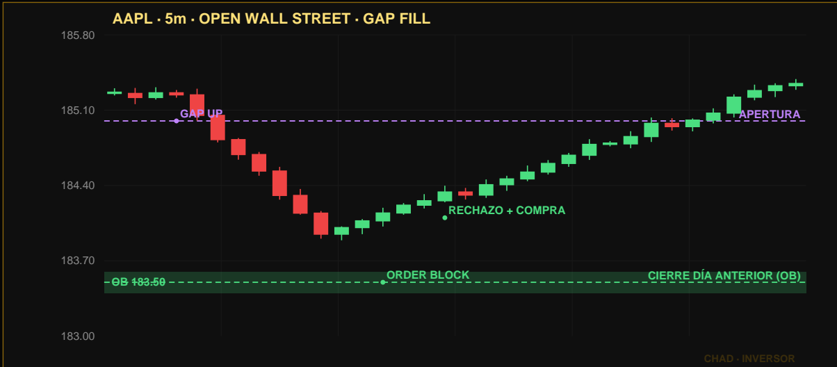
Caso 7: Apple abre con gap alcista hasta 185, retrocede agresivamente a 183.50 (cierre anterior = Order Block), rechaza con mecha.