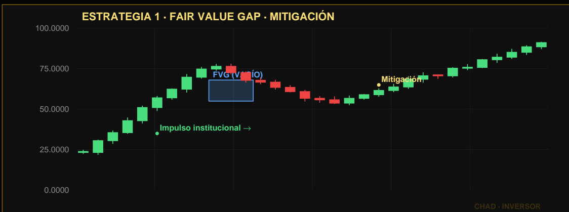
Vela de impulso (cuerpo grande) deja un FVG. Precio regresa a mitigar el vacío → entrada en la dirección del impulso.

La Ejecución: Esperamos que el precio regrese a ese vacío (FVG) en temporalidades de 5m o 15m para llenarlo, momento en el cual nos posicionamos en la dirección original del impulso institucional.