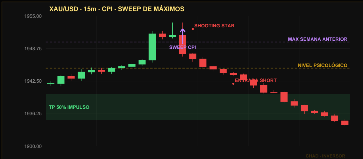
Caso 3: Dato CPI dispara precio al alza superando máximo semanal. Cierre de 15m como Shooting Star = reversión institucional.